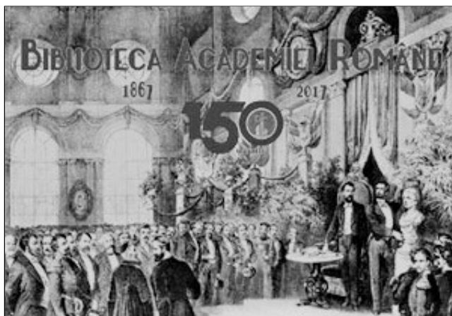
Afiș sesiune aniversar – Aula Academiei Române. 2