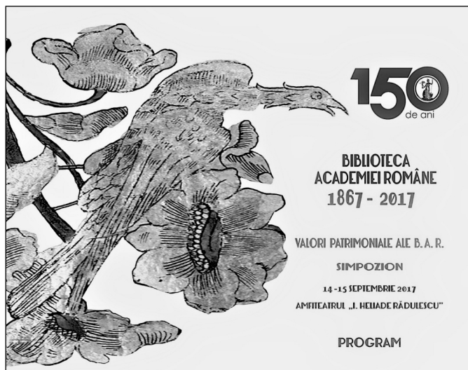
Program simpozion „Valori patrimoniale ale Bibliotecii Academiei Române” 5